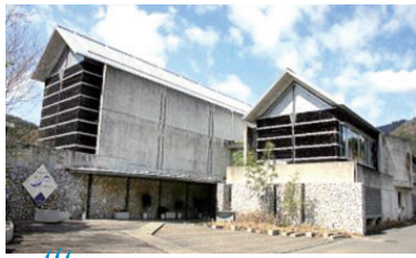
ホテル星羅四万十 (温泉)