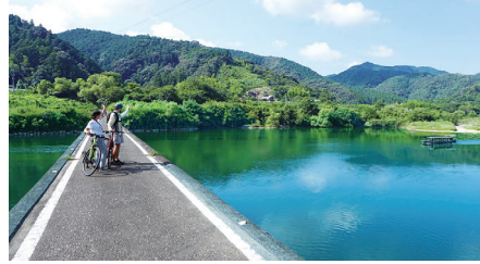
かわらっこ～勝間沈下橋～四万十川右岸 ～高瀬沈下橋～国道441号～かわらっこ