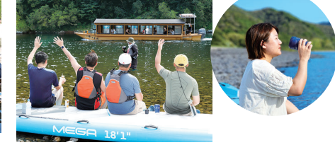
メガサップ・コーヒープレイクタイム