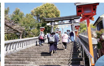
LOI LOI しまんと