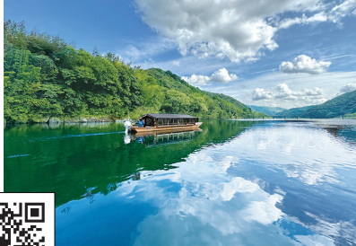
屋形船遊覧 (なっとく)