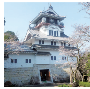
11 四万十郷土資料博物館